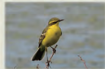
ツメナガセキレイ