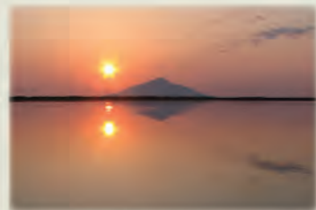
パンケ沼に沈む夕日と利尻山