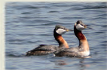
アカエリカイツブリ